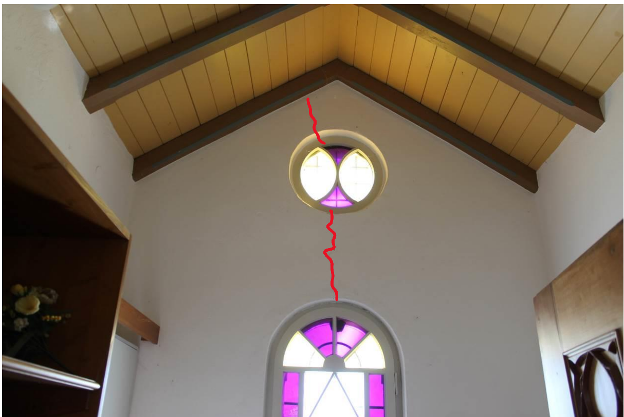
Bild 13: Sakristei, starker Mauerwerksriss durch Schub aus der Dachkonstruktion.